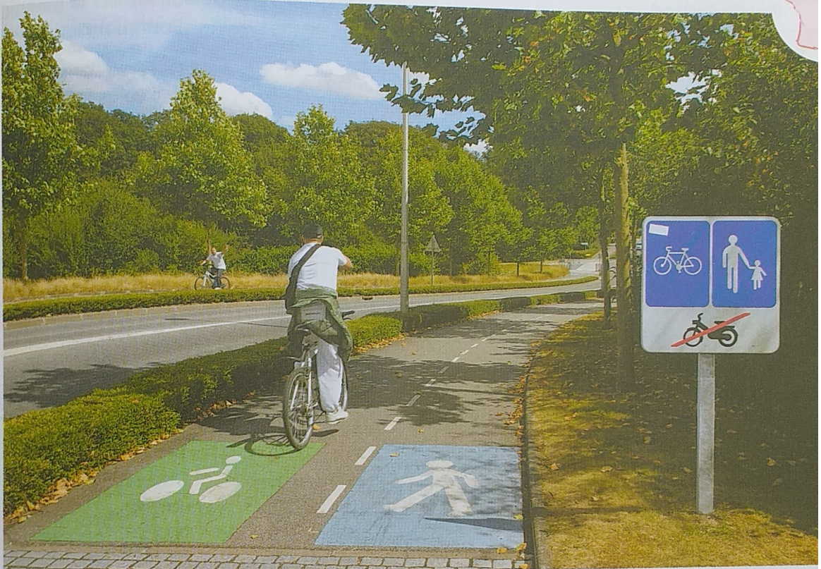
Doc. 1 Voies de circulation à Saint-Quentin-en-Yvelines dans les Yvelines (Ile-de-France)