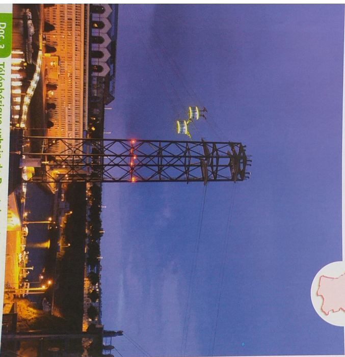
Doc. 3 Téléphérique urbain de Brest dans le Finistère (Bretagne) On distingue les deux cabines destinées au transport des personnes.