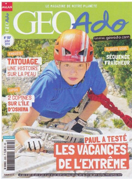
Doc.1 : couverture du magazine « Géo ADO », n°137