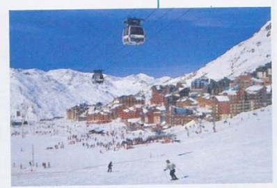
d. Station de sports d'hiver de Val-Thorens (Savoie).