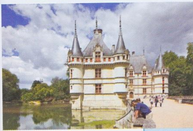
a. Château d'Azay-le-Rideau dans la vallée de la Loire (Indre-et-Loire).