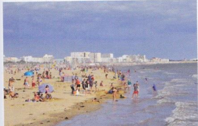
c. Station balnéaire de Saint-Jean-de-Monts (Vendée).