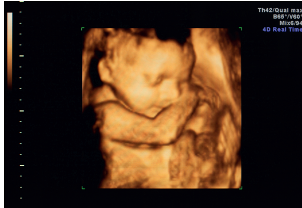
Échographie en 3 dimensions.

① Observe l'échographie en 3D d'un fœtus dans le ventre de sa mère, puis place, sur celle en 2D, les légendes suivantes : nez, yeux, oreille, bras, jambe, tête.